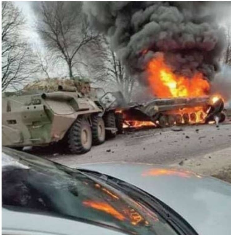
Vasario 24-osios rytą prasidėjo Ukrainos okupacija.