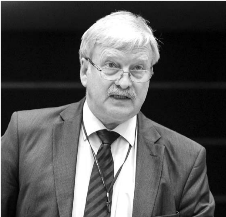
Europos Parlamento narys Bronis Ropė.

Onkologinės ligos istorija paženklinas bent vieno žmogaus iš mūsų artimo rato – giminaičio, draugo ar kolegos gyvenimas. Kiekvieną kartą išgirsti žinią apie šią diagnozę yra didžiulis šokas, net jei ji nustatyta ne mums patiems. Net skaitant žodį – vėžys – kyla siaubas. Yra būdų, galinčių šios ligos sergamumo rodiklius stipriai sumažinti, jei ne sustabdyti apskritai. Pagaliau Europos Parlamente buvo priimtas europinio lygmens dokumentas, kuriuo siekiama pasinaudoti visomis galimybėmis užkirsti vėžiui kelią Europos visuomenėje.