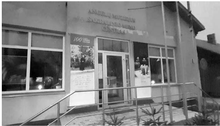
Angelų muziejaus pastatą Anykščių rajono savivaldybei siūlo pirkti dvasininkai.