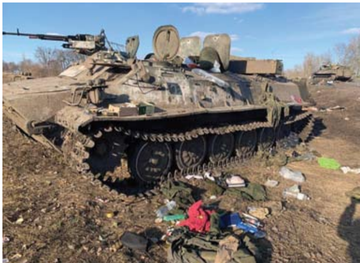
Ukrainos kariuomenė ginasi tik savo jėgomis.

tikrą didvyriškumą. Daugeliu kryptių priešas buvo sustabdytas. Kovoja. nepavargsta”, - pabrėžė Valstybės vadovas. Jis taip pat palygino dabartinę situaciją Kijeve su 1941 m. „Baisūs sproginiai ryto danguje virš Kijevo, bombardavimas, smūgis į namą, gaisras – visa tai primena pirmąją tokią ataką prieš mūsų sostinę, įvykusią 1941 m.“, - pasakė V. Zelenskis. „UKRINFORM“